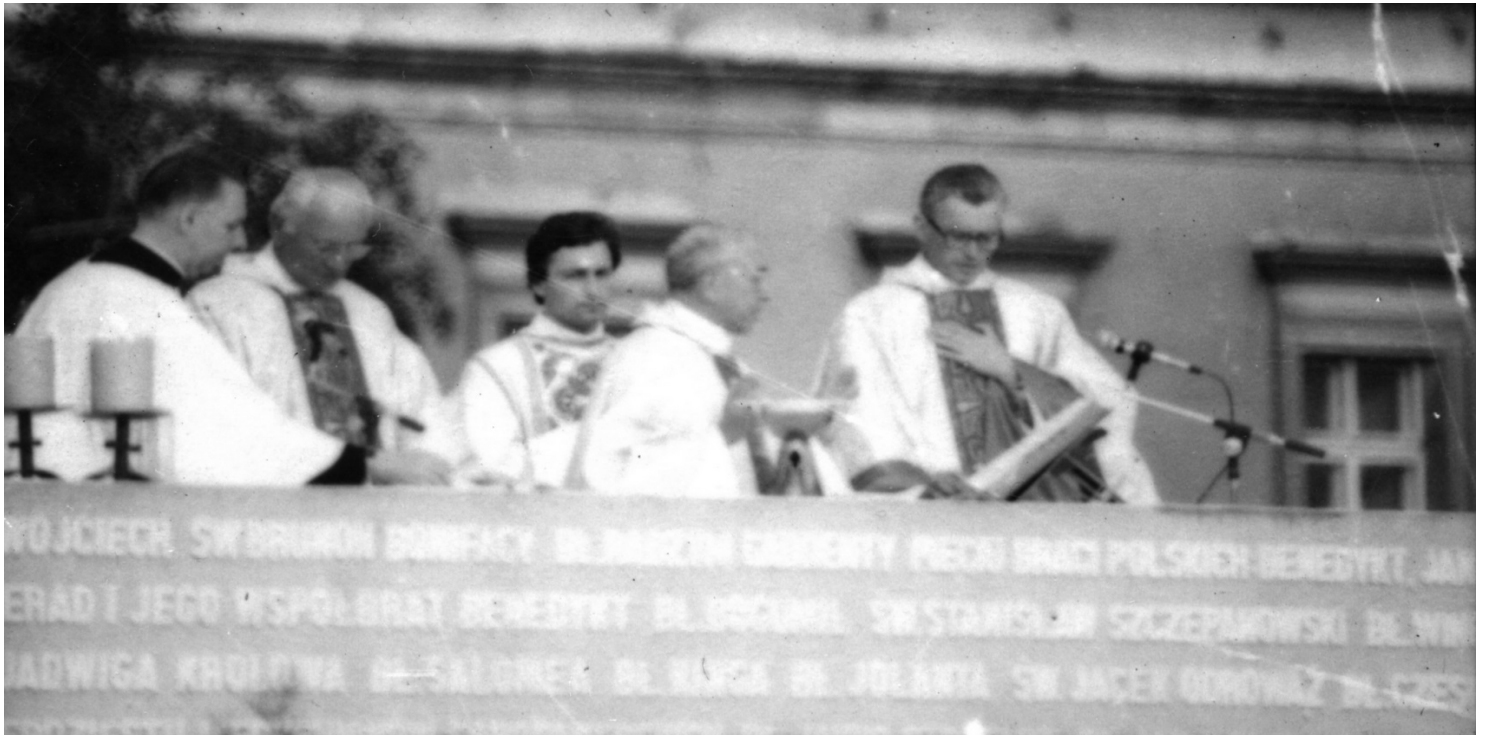
Uroczystości pogrzebowe, msze i modlitwy w intencji zmarłego prymasa polski ks. kard. Stefana Wyszyńskiego. Po środku kardynał Agostino Casaroli, pierwszy z prawej arcybiskup Franciszek Macharski, 31 maja 1981 r.

https://przystanekhistoria.pl/pa2/tematy/kosciol/43078,Kardynal-Franciszek-Macharski-1927-2016.html