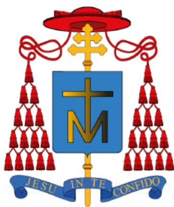
Herb kard. Franciszka Macharskiego - Jezu ufam Tobie.