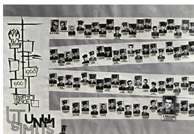
Pamiętkowe tableau alumnów-żołnierzy 54. SBRT w Bartoszycach służących w latach