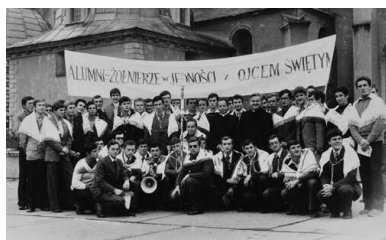
Spotkanie alumnów na Jasnej Górze po zakończeniu służby wojskowej

Alumnom nie pozwalano posiadać więcej niż dwie książki, przy czym często były to Pismo Święte i modlitewnik. Ci, którzy w czasie służby chcieli się uczyć, by nie stracić cennego czasu i kontaktu z seminarium, musieli ukrywać inne wydawnictwa, w tym różne skrypty do nauki.