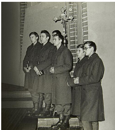
Alumni-żołnierze 56. Szkolnego Batalionu Ratownictwa Terenowego w Brzegu podczas Mszy św.