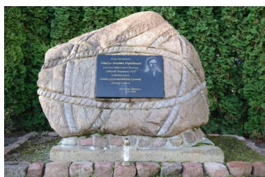
Tablica upamiętniająca służbę wojskową bł. ks. Jerzego Popiełuszki w Bartoszycach

Drugi okres, lata 1964-1966, to czas eksperymentów – kleryków wcielano do specjalnych, eksperymentalnych „kompanii kleryckich” ulokowanych na tak zwanych Ziemiach Odzyskanych: w Gdańsku, Szczecinie i Opolu, następnie w Bartoszycach, Brzegu i Kołobrzegu. Nad alumniami pracowali specjalnie dobrani i przygotowani oficerowie, którzy mieli jasno sprecyzowany cel, jakim było łamanie powołań kapłańskich. Co więcej, do kompanii przydzielano też specjalnie wytypowanych „świeckich” żołnierzy, rekrutujących się między innymi z komunistycznych organizacji młodzieżowych.