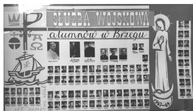
Tableau służby wojskowej alumnów w jednostce wojskowej w Brzegu w latach 1967-1969

Szacuje się, że do wojska powołano blisko 3000 alumnów, choć jest to liczba niepewna. Najwięcej wcielono ich w drugiej połowie lat sześćdziesiątych, co było spowodowane silnym napięciem stosunków państwa i Kościoła w związku z konfrontacją milenijną, czyli kościelnymi obchodami Milenium Chrztu Polski i państwowymi Tysiąclecia Państwa Polskiego. Rekordowy był rok 1968, gdy do wojska powołano prawie 300 kleryków z całego kraju. Wyraźny spadek liczby wcielanych, a także powolne osłabianie tej antykościelnej represji, następowały od połowy lat siedemdziesiątych. W 1973 roku zlikwidowano jednostkę w Szczecinie, w 1979 w Brzegu. W 1979 wcielono też ostatnich kleryków, by w kwietniu 1980 roku zwolnić ich wszystkich. Było to skutkiem wieloletnich zabiegów Episkopatu Polski i samego prymasa Wyszyńskiego.