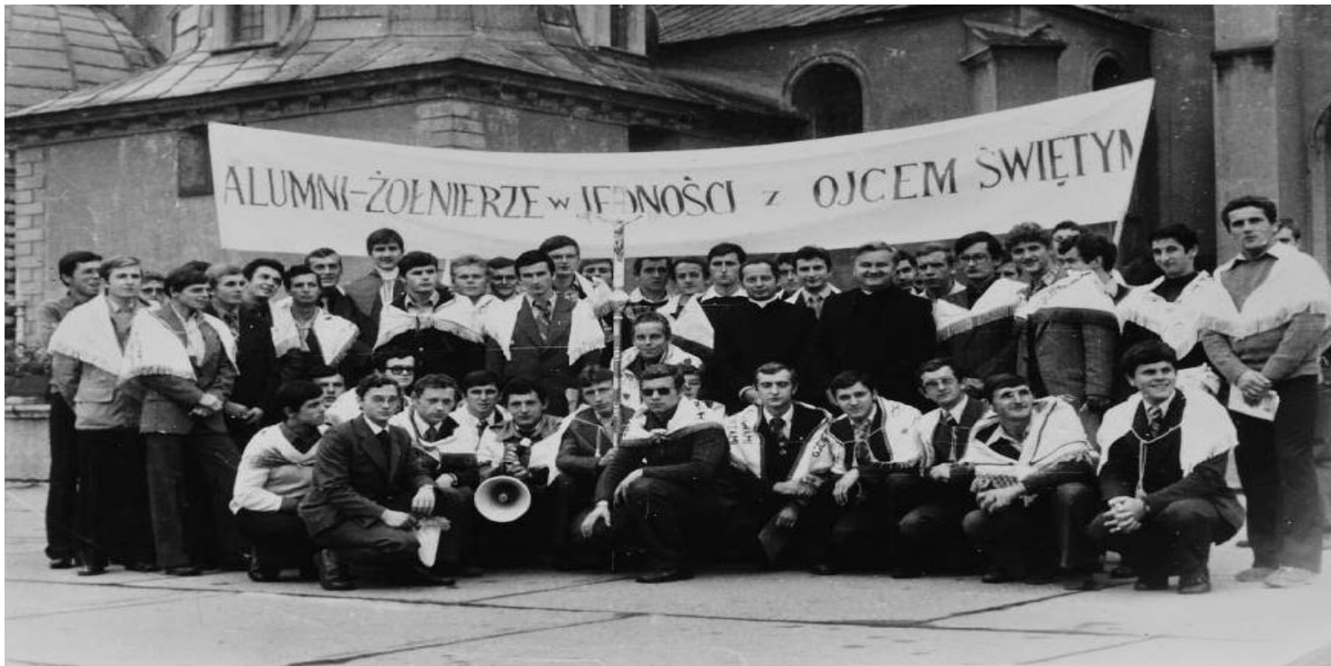
Spotkanie alumnów na Jasnej Górze po zakończeniu służby wojskowej (ze zbiorów Kurii Biskupiej Ordynariatu Polowego)

https://przystanekhistoria.pl/pa2/tematy/kosciol/106339,Wybic-z-glowy-kaplanstwo-Sluzba-alumnow-w-Ludowym-Wojsku-Polskim-19551980.html