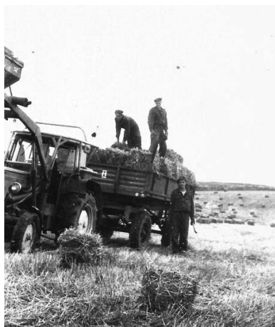
Alumni-żołnierze podczas akcji żniwnej

Alumnom prezentowano filmy propagandowe, codziennie musieli oni też obowiązkowo oglądać „Dziennik Telewizyjny”. Nie szczędzono im przy tym wyniszczającej musztry i ćwiczeń bojowych; wykorzystywano do różnych prac budowlanych i akcji żniwnych.