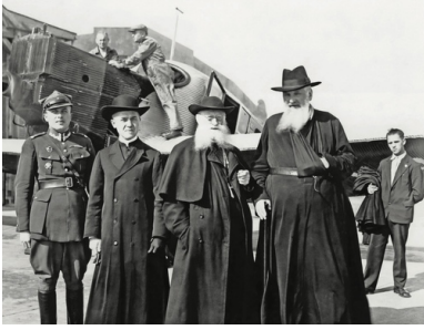
Metropolita mohylewski abp Edward Ropp (w okularach) i abp metropolita lwowski obrządku greckokatolickiego Andrzej Szeptycki (z prawej), Poznań, 1930 r.