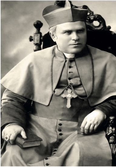
Bp Jan Cieplak