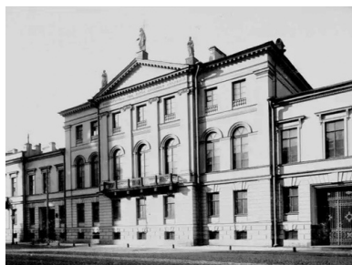
Rzymskokatolicka Akademia Duchowna w Petersburgu