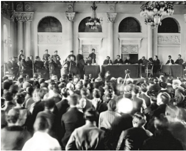
Moskiewski proces abp. Jana Cieplaka, ks. Konstantego Budkiewicza i innych księży; po prawej przy małym stoliku w środku prokurator Nikołaj Krylenko, 1923 r.