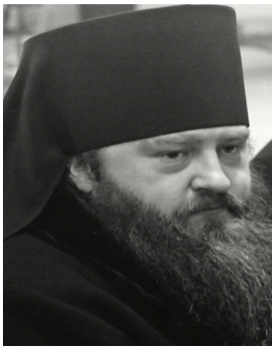
Nikodem/Borys Rotow