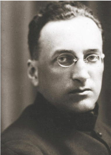
Ks. Walerian Meysztowicz, 1932 r.