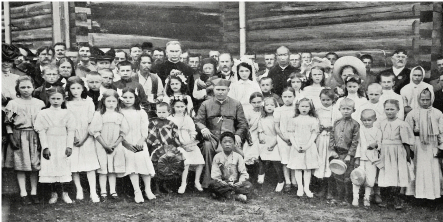
Bp Jan Cieplak w parafii katolickiej w Chabarowsku, 1909 r.

https://przystanekhistoria.pl/pa2/tematy/kosciol/103957,Biskup-ktory-nie-znal-dnia-ani-godziny-Jan-Cieplak-18571926.html