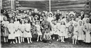
Bp Jan Cieplak w parafii katolickiej w Chabarowsku, 1909 r.