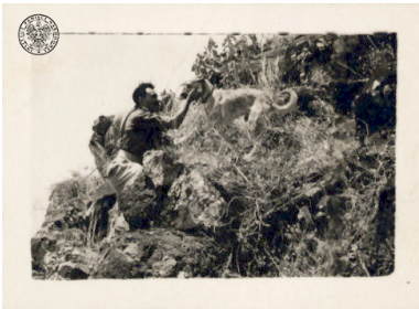
Hm. Zdzisław Peszkowski z psem Billem. Rukadi, 1945 r.

Podczas formowania się Armii Andersa Peszkowski zasilił szeregi odtwarzanego 1. Pułku Ułanów Krechowieckich. W Wielką Środę 1942 roku, wraz ze współtowarzyszami broni, w ramach ewakuacji Armii Andersa z ZSRR, opuścił „niehumanitarną ziemię” i przez Morze Kaspijskie udał się do Iranu.