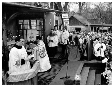
Karol Wojtyła w czasie mszy w tymczasowej kaplicy, 1967