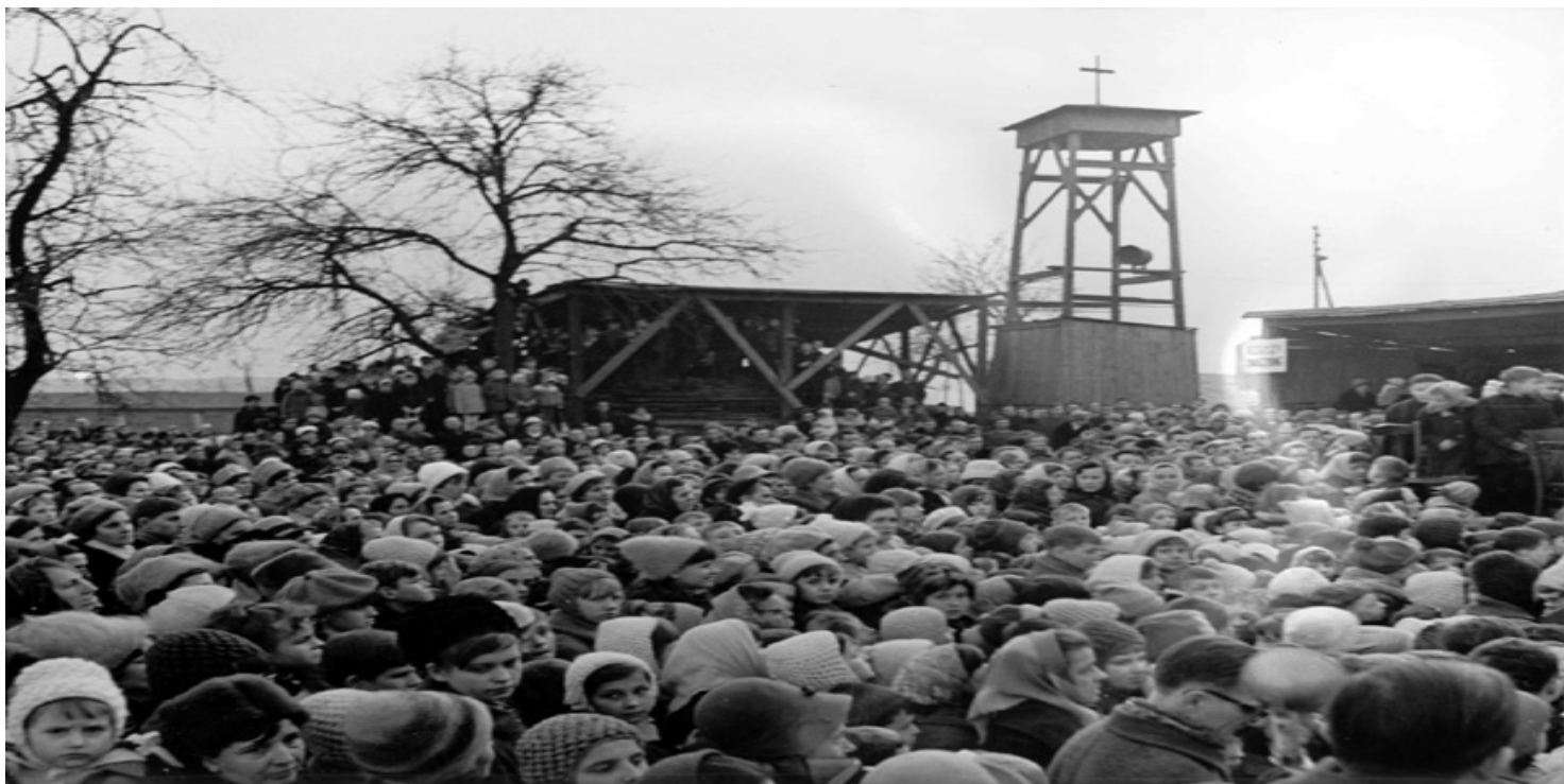
Msza w tymczasowej kaplicy

https://przystanekhistoria.pl/pa2/tematy/kosciol/100921,Arka-Pana-Pierwszy-kosciol-w-Nowej-Hucie.html