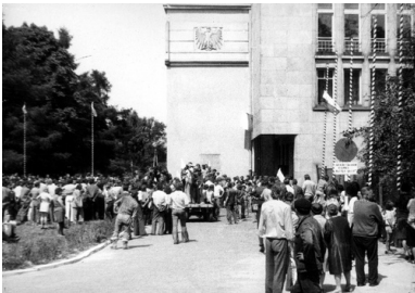
Demonstracja przed gmachem KW PZPR w Radomiu.