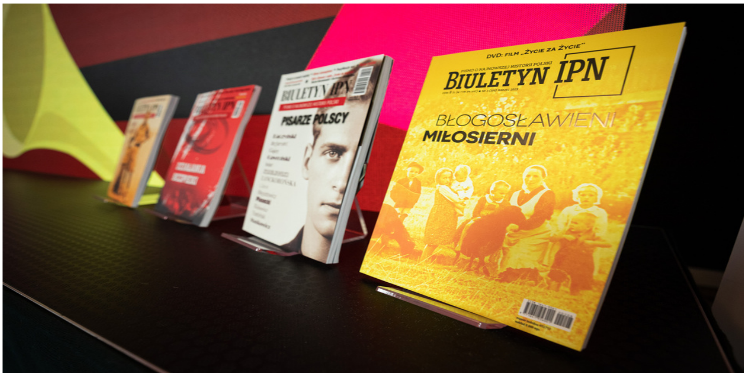
„Biuletyn IPN” 3/2023

https://przystanekhistoria.pl/pa2/tematy/konspiracja/99817,Emanuel-Prokesch-vel-Jan-Baranowski-Przyczynek-do-dziejow-konspiracji-wilenskiej.html