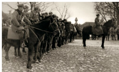
Żołnierze 3. Wileńskiej Brygady AK w Turgielach, 9 IV 1944 r.