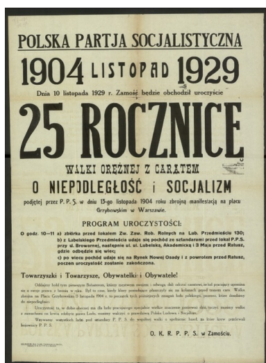
Afisz dot. obchodu 25. rocznicy manifestacji na placu Grzybowskiem w Warszawie z 1904 r., ze zbiorów Biblioteki Narodowej

Na rozwój świadomości narodowej we wszystkich zaborach wpłynęła jednak nie tylko działalność polityczna. Ważną rolę odegrała twórczość Henryka Sienkiewicza, piszącego „ku pokrzepieniu serc” o wielkości dawnej Rzeczypospolitej, którego chłopci witali słowami „Tyś nas zrobił Polakami”, malarstwo Jana Matejki, a w wypadku inteligencji – budzące dumę z przeszłości Polski prace historyczne Szymona Askenazego. Nieocenione zasługi w uświadomieniu narodowym chłopów mieli polski nauczyciel i ksiądz.