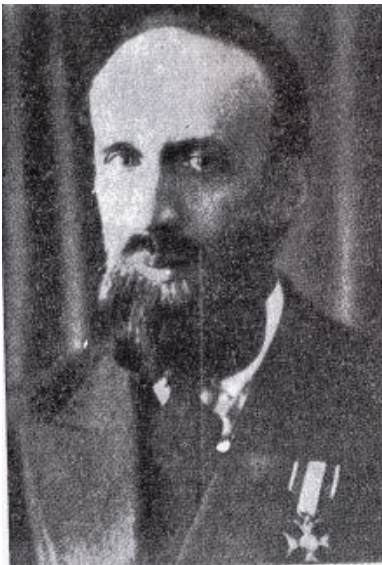
Tadeusz Szturm de Sztrem w 1933 r.