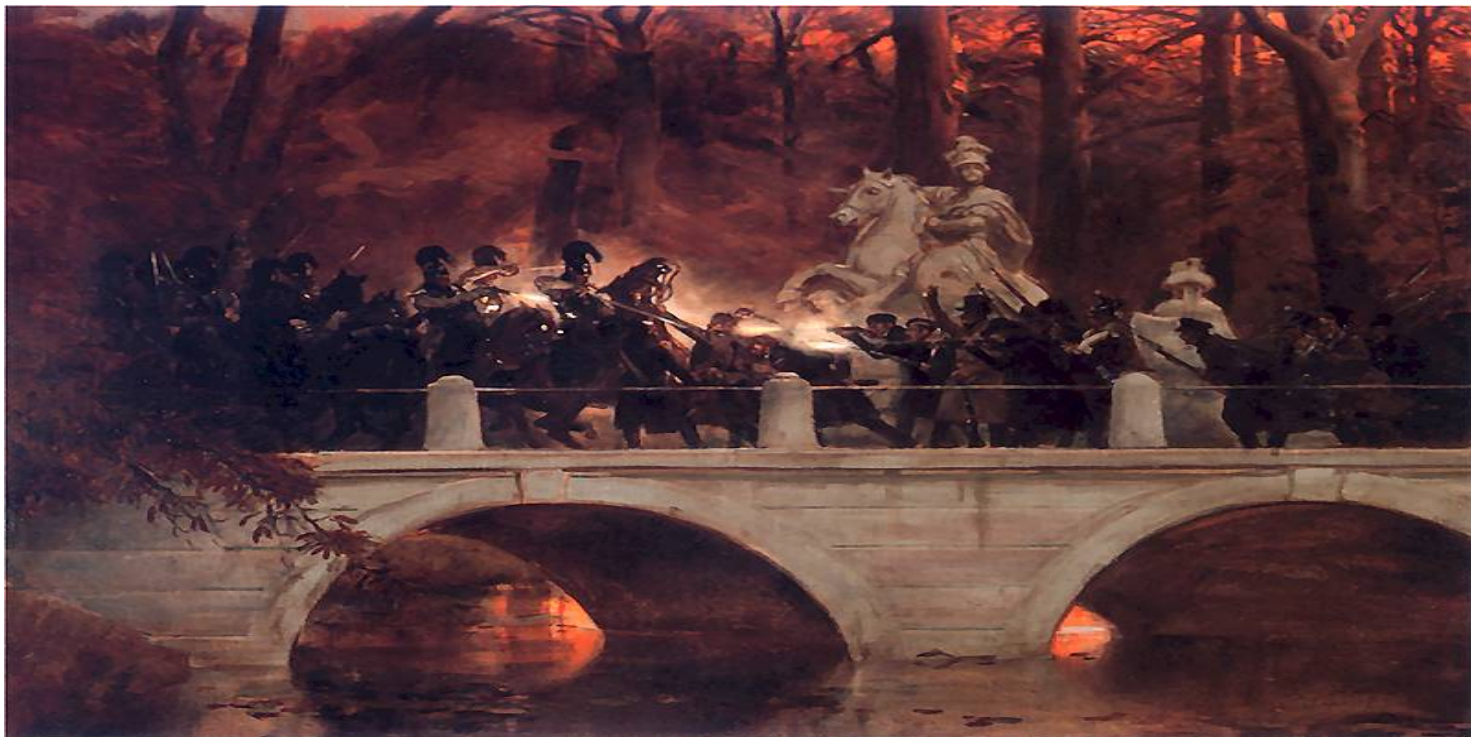
Obraz Wojciecha Kossaka Starcie belwederczyków z kirasjerami rosyjskimi na moście w Łazienkach 29 listopada 1830

https://przystanekhistoria.pl/pa2/tematy/konspiracja/96157,Wiek-niewoli.html