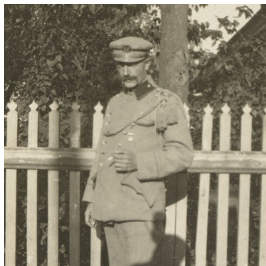
Andrzej Strug jako żołnierz Legionów Polskich, 1915 r.

W Archangielsku znalazł się w połowie 1897 r. Przyszły pisarz Andrzej Strug należał więc, podobnie jak Józef Piłsudski, do ostatniego pokolenia rodaków zsyłanych od ponad stu lat w głąb imperium – pokolenia zamykającego długi łańcuch carskich katorżników. Znalazł się w bardziej cywilizowanych warunkach niż więźniowie od czasów Konfederacji Barskiej i Powstania Kościuszkowskiego, mógł więc przemyśleć swą postawę, dokonać wyborów, przygotować się do dalszej drogi życiowej.