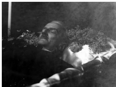
Andrzej Strug na łożu śmierci, 1937 r.

przekonuje masy polskiego społeczeństwa do racji niepodległościowych na początku wojny wcale nieoczywistych; nakłania je do płacenia ceny – bo zwycięstwa nie uzyska się za darmo.