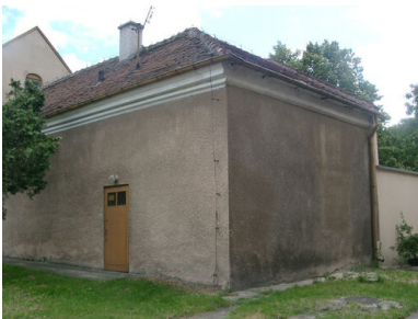
Busko-Zdrój, ul. Sądowa (wcześniej Kościelna) - dawne więzienie gestapo (a po wojnie UB). Mieściło się w zespole