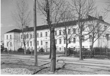
Busko-Zdrój, 1942 (okupacja niemiecka). Budynek okupacyjnego niemieckiego starostwa powiatowego.