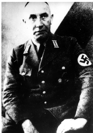
Friedrich Übelhör, 1941/1942; gdy Niemcy dokonywali Zbrodni Zgierskiej był, w ramach niemieckiej okupacji Polski, prezesem rejencji łódzkiej. Jeden z winnych Zbrodni Zgierskiej.

Na placu już poprzedniego dnia wykonano prace, które dla zebranych mogły być wskazówką, co się ma w tym miejscu wydarzyć. Wykonano szeroki nasyp ziemny i wyrównano przed nim grunt. Około godz. 10 na plac wjechały zakryte ciężarówki i samochody osobowe z niemieckimi dygnitarzami. Z ciężarówek zaczęto wyciągać więźniów; wszyscy mieli skrępowane z tyłu ręce i powiązani byli sznurami w grupach po piętnaście osób. Wkrótce wyjaśnił się cel tych wszystkich przygotowań. Przemówił niemiecki dygnitarz (prawdopodobnie prezes rejencji łódzkiej Friedrich Übelhör), który oznajmił, że w odwet za dwóch zabitych Niemców, rozstrzelanych zostanie stu Polaków.