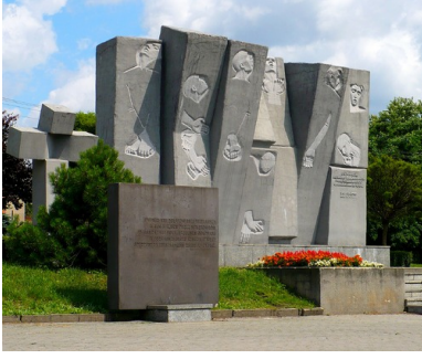
Pomnik na placu Stu Straconych w Zgierzu.