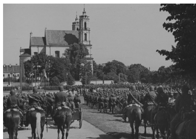
Jubileusz dwudziestopięciolecia 1. Dywizji Piechoty Legionów w Wilnie i piętnastolecia 14. Pułku Ułanów Jazłowieckich we Lwowie Fragment uroczystości na placu Łukiskim w Wilnie, sierpień 1939 r.

ćwiczebnym szefem sztabu dywizji, a następnie w czasie ćwiczeń międzydywizyjnych gen. bryg. Stanisława Burhardt-Bukackiego pełnił analogiczne stanowisko. 29 października 1927 r. Świtalski został przeniesiony do Warszawy, na stanowisko szefa Oddziału Wyszkożenia w Dowództwie Okręgu Korpusu nr I, a 26 kwietnia 1928 r. został przesunięty na stanowisko szefa Oddziału Ogólnego w tymże sztabie DOK I. 20 lutego 1930 r. Świtalski został przeniesiony, dla odbycia stażu liniowego, na stanowisko zastępcy dowódcy stołecznego 30. pp stacjonującego na terenie Cytadeli. W czasie służby w pułku wziął udział w koncentracji letniej 10. DP, w czasie której kierował ćwiczeniami batalionowymi i pułkowymi, a w czasie ćwiczeń aplikacyjnych pełnił rolę dowódcy pułku. 1 marca 1931 r. objął stanowisko szefa sztabu DOK nr IV w Łodzi. W tym czasie był już podpułkownikiem dypl. ze starszeństwem z 1 stycznia 1931 r.