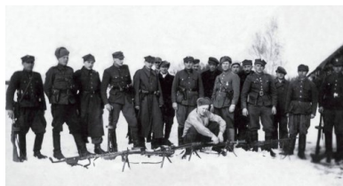
Zgrupowanie majora Hieronima Dekutowskiego „Zapory”, lato 1946 r.