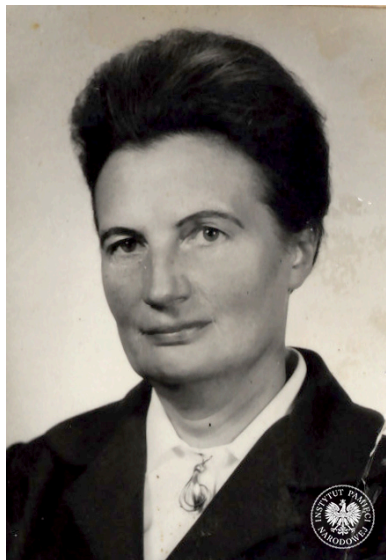
Halina Szwarc, ok. 1975 r.

Kariera zawodowa Haliny nabrała tempa w 1964 r., kiedy przeprowadziła się do Warszawy i podjęła pracę na tamtejszej Akademii Wychowania Fizycznego. W latach 1965–1969 była jej prodziekanem, a w latach 1969–1971 – prorektorem. W 1966 r. uzyskała tytuł profesora. W Warszawie postanowiła zająć się też nową dziedziną medycyny – gerontologią i została w niej uznaną specjalistką. W 1975 r. założyła pierwszy w Polsce Uniwersytet Trzeciego Wieku.