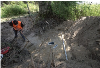
Cypliszki. Prace poszukiwawcze w 2022 r.

Akowcy pochowali go na skraju lasu na terenie majątku Cypliszki. Przeprowadzona przez komunistów kolektywizacja wsi zniszczyła folwark. Z czasem zarys grobu również się zatarł. Miejsce pochówku jest dziś trudno dostępne, leśnie drogi zarosły. Wiosną i jesienią podmokły teren dodatkowo utrudnia dojazd, nawet dla samochodów terenowych. Dopiero po odzyskaniu przez Litwę niepodległości, z inicjatywy miejscowych Polaków, postawiono nowe upamiętnienie. Czy znajduje się dokładnie w miejscu pochówku? Na to pytanie miały dać odpowiedź badania archeologiczne, które we wrześniu 2022 roku przeprowadził zespół z Biura Poszukiwań i Identyfikacji Instytutu Pamięi Narodowej. Nieopodal oznaczonego miejsca odnaleziono szczątki mężczyzny w dobrze zachowanym mundurze Wojska Polskiego. Szczątki zostały poddane oględzinom antropologicznym na Uniwersytecie w Wilnie. Czy odnaleziony żołnierz to Napoleon Ciukszo ps. „Waligóra” będzie można stwierdzić po porównaniu DNA zmarłego z materiałem genetycznym udostępnionym przez krewnych.