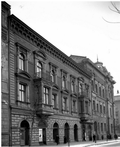
Widok zewnętrzny budynku Akademii Sztuk Pięknych w Krakowie, 1926 r.