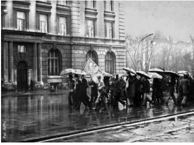
Manifestacja Konfederacji Polski Niepodległej 11 listopada 1979 r. na Placu Matejki w Krakowie.