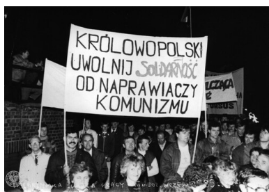
Uczestnicy Pielgrzymki Świata Pracy do Częstochowy we wrześniu 1989 r. niosą transparent o treści: Królowo Polski/ uwolnij Solidarność/ od naprawiaczy/ komunizmu .