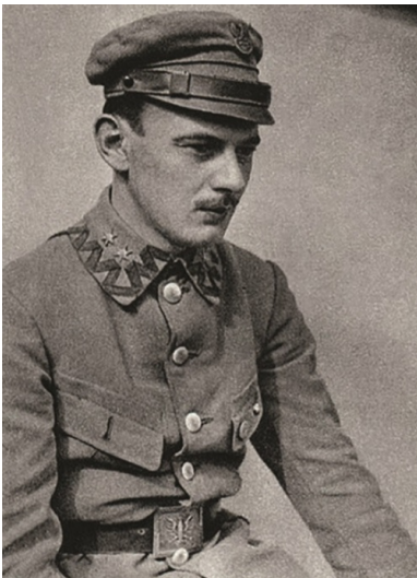
Por. Czesław Młot-Fijałkowski, okres legionowy.

Nieco inaczej potoczyły się wydarzenia w innej części Sosnowca. Przed południem 21 grudnia żołnierze 26. Pułku Piechoty płk. Jana Rządковского otoczyli lokal sosnowieckiej Rady Delegatów Robotniczych przy ul. Staszica, będący jednocześnie komisariatem Czerwonej Gwardii. Wewnątrz zabarykadowała się grupa komunistów. Ostrzelanie budynku nie przyniosło początkowo efektów, chociaż zginął gwardzista Władysław Dyląg. Ze względu na dysproporcję sił oraz brak szans na pomyślne zakończenie walki komuniści się poddali. Dzięki rozbiciu Czerwonej Gwardii odzyskano kontrolę nad zakładami przemysłowymi, a 27 grudnia strajk wygasł 10 .