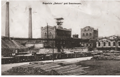
Kopalnia „Saturn” w Czeladzi, 1912 r. Fot. Śląska Biblioteka Cyfrowa

Kolejne miesiące przyniosły unormowanie sytuacji, chociaż daleko było do jej zupełnego wyjaśnienia. W lipcu 1919 r. rozwiązano ostatecznie rady delegatów robotniczych. W sierpniu w Mysłowicach doszło do masakry górników przez oddział Grenzschutzu, co doprowadziło do wybuchu I Powstania Śląskiego. Powoli konflikt graniczny odsuwał się od Zagłębia na zachód.