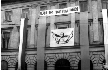
Kraków. Klasztor Zgromadzenia Księży Misjonarzy (widok od strony ul Stradomskiej), 18 VI 1983 r.

Tekst stanowi fragment książki „Dawniej to było. Przewodnik po historii Polski” (2019) Całość publikacji dostępna w wersji drukowanej w księgarni internetowej ksiegarniaipn.pl