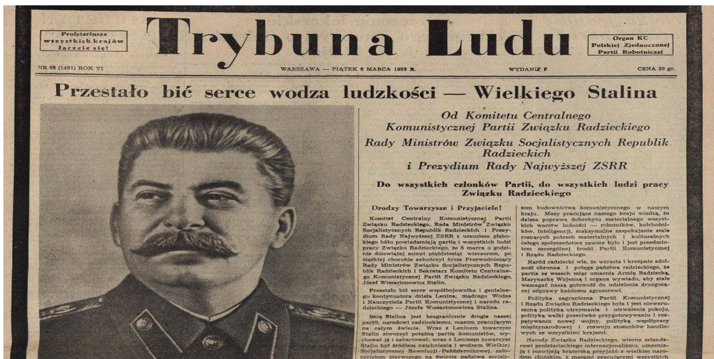
"Trybuna Ludu" informuje o śmierci Stalina

https://przystanekhistoria.pl/pa2/tematy/jozef-stalin/92425,Pogrzeb-Stalina-film-dokumentalny-Siergieja-Loznicy.html