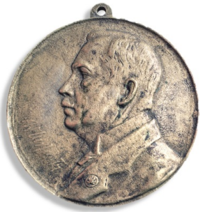
Medalion z wizerunkiem Wojciecha Korfanteo odlany w związku z niedoszłą nominacją na premiera, 1922 r. Ze zbiorów Muzeum Miejskiego w Siemianowicach Śląskich

gabinet Witosa podał się do dymisji. W tej sytuacji Korfantemu pozostała tylko działalność parlamentarna.