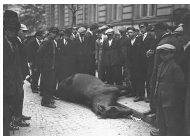
Grupa przechodniów podczas oglądania na ulicy zabitego konia, maj 1926