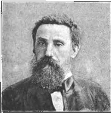
Portret Bolesława Limanowskiego z książki „Upominek. Książka zbiorowa na cześć Elizy Orzeszkowej (1866-1891)”

Oznaczało to wysunięcie na plan pierwszy postulatu walki o niepodległość.