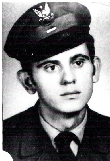
Kleryk Jerzy Popiełuszko w mundurze wojskowym.