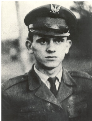
Alumn Jerzy Popiełuszko w jednostce w Bartoszycach, 1966 r.

Tymczasem opieka medyczna w wojsku również pozostawiała wiele do życzenia. Gabinet lekarski, owszem, istniał, jednak tylko teoretycznie. Trudno powiedzieć, by można było w nim uzyskać fachową poradę. Dawni koledzy ks. Popiełuszki do dziś pamiętają, że każdy alumn, który zachorował i trafił do tamtejszego lekarza, otrzymywał jedną tabletkę, zawsze o tej samej nazwie: „na ból gardła”. Bez względu na rodzaj dolegliwości.