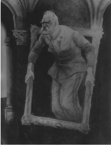
Karykatura wykonana przez artystę malarza Zdzisława Czermańskiego "W ramach Konstytucji" przedstawiająca marszałka Polski Józefa Piłsudskiego.