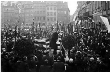
Manifestacja w Warszawie na cześć uchwalenia nowej konstytucji. Wicemarszałek sejmu Stanisław Car opuszcza trybunę po wygłoszeniu przemówienia na Rynku Starego Miasta w Warszawie, marzec 1935 r.

Posłowie BBWR zorientowali się, że mają wymaganą większość i – przy protestach posła Strońskiego – konstytucję uchwalili. Wydawało się wówczas, że – wobec przewagi BBWR w Senacie – proces legislacyjny zostanie zakończony bardzo szybko. Piłsudski jednak zaprosił do siebie premiera Walerego Sławka i marszałka Sejmu Kazimierza Świątalskiego i stwierdził, że „...dla Ustawy Konstytucyjnej uchwalenie jej dowcipem i trikiem nie jest zdrowe i że wobec tego należy ten trik pokryć i zneutralizować przez szczegółową debatę i zmiany w Senacie..”