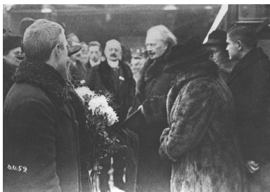
Przyjazd Ignacego Jana Paderewskiego do Poznania, 27 grudnia 1918 r.