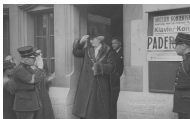
Ignacy Jan Paderewski podczas pobytu w Szwajcarii, opuszcza salę koncertową po swym koncercie w Solurze, 1937 r.

W istocie, krótko po zakończeniu nauki u Leszetyckiego, Paderewski rozpoczął błyskotliwą karierę pianisty-wirtuoza, szturmem zdobywając największe i najznamienitsze sale koncertowe świata.