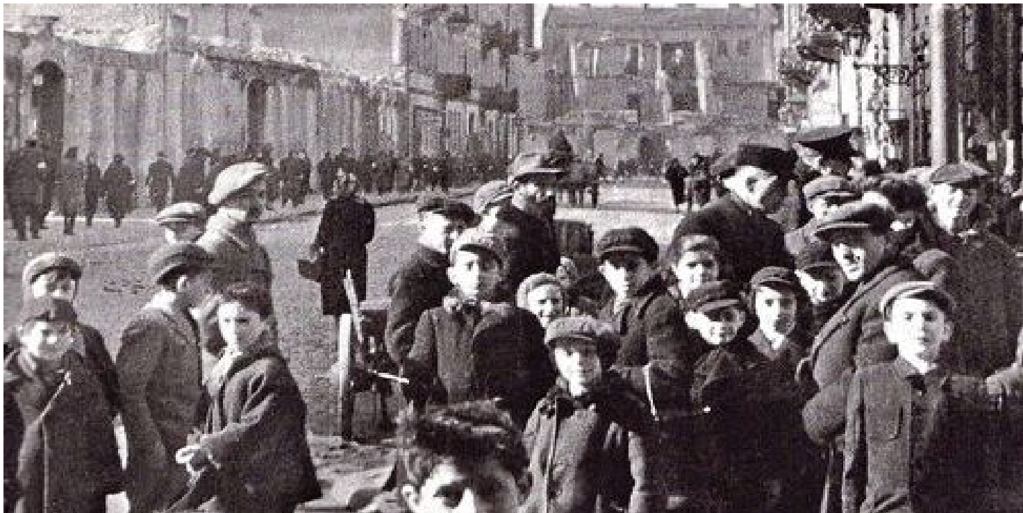
Dzieci w getcie warszawskim

https://przystanekhistoria.pl/pa2/tematy/holocaust/97098,Pomoc-Zydom-karana-smiercia-Zarys-niemieckich-przepisow-okupacyjnych-na-obszarze.html