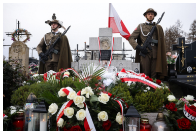
Grób rodziny Ulmów na cmentarzu w Markowej - 24 marca 2023.

chcieli, by Żydzi opuścili Polskę, i wspierali ich emigrację do Palestyny czy Ameryki. Charakterystyczny jest protest Zofii Kossak, która nie lubiła Żydów jako mniejszości polskiej, ale widziała w nich ludzi i walczyła o godność człowieka. To ona najgłośniej wołała: „Tak nie może być!”. Nawoływała społeczeństwo polskie i świat, aby coś zrobić w tej sprawie, oraz sama pomagała Żydom na dużą skalę w sposób zorganizowany.