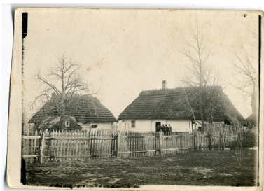
Markowa w obiektywie Józefa Ulmy (ze zbiorów Mateusza Szpytmy)

MS: To jest zastanawiające, bo przecież przed wojną ta wieś raczej nie wyróżniała się od innych, sąsiednich, relacjami polsko-żydowskimi. I tu przecież też były od 1942 r. łapanki Żydów, które polscy mieszkańcy musieli przeprowadzać na rozkaz niemiecki. Markowa to jednak wieś największa, bardzo spójna (tylko nieliczni jej mieszkańcy nie mieli tu przodków sięgających XIV w.), a znaczna grupa gospodarzy była całkiem majątna i dysponowała rezerwami żywnościowymi. W Markowej ukrywali się Żydzi sąsiedzi oraz spoza miejscowości. Ale ci ostatni albo byli spokrewnieni z markowskimi, albo pochodzili z niedalekiej okolicy i byli dobrze znani polskim mieszkańcom wioski.