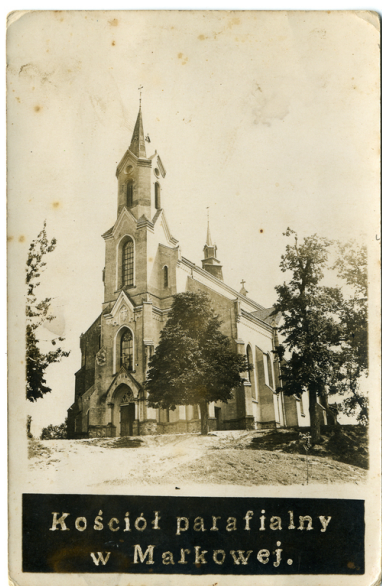
Kościół parafialny w Markowej