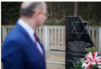
Pomnik upamiętniający 375 Żydów na Cmentarzu Ofiar Hitleryzmu 1939-1945 - Jagiełka, 24 marca 2023.