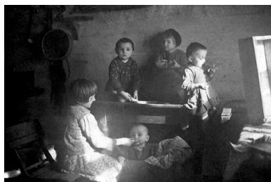
Dzieci Ulmów

Czyli żebyś ty nie miał z nimi kłopotu. Ironicznie w stylu... myśmy to zrobili dla ciebie. Co ciekawe, Dieken nie był nazistą w sensie formalnym.