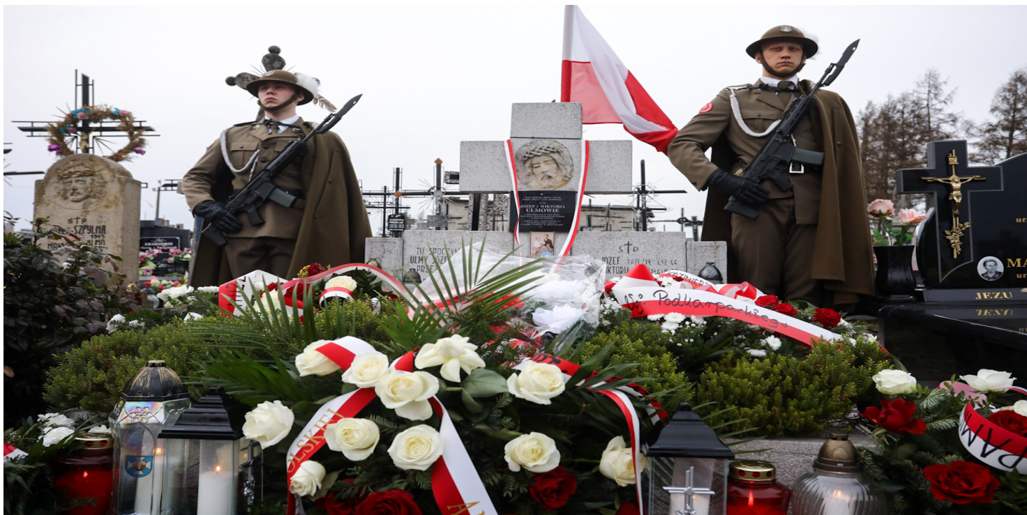
Grób rodziny Ulmów na cmentarzu w Markowej – 24 marca 2023.

https://przystanekhistoria.pl/pa2/tematy/holocaust/103231,Heroizm-przezwyeczyl-lek.html