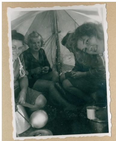
Karta z kroniki „Wędrownych Ptaków”

Po prawie półrocznym pobycie w Szwecji, 15 października 1945 r. harcerki „Wędrownych Ptaków” powróciły do Polski.