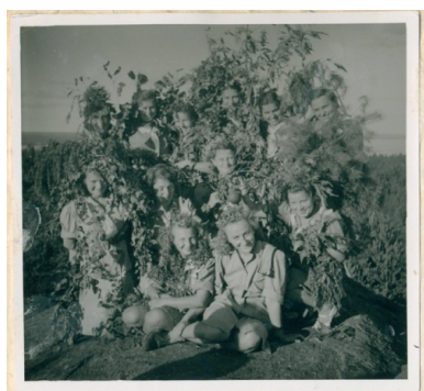
Karta z kroniki „Wędrownych Ptaków”, Fot. Chorągiew Łódzka ZHP