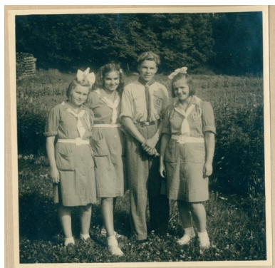
Karta z kroniki „Wędrownych Ptaków”