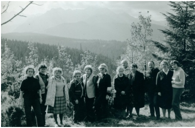
Zlot członkiń „Wędrownych Ptaków”, Głódówka 1984.