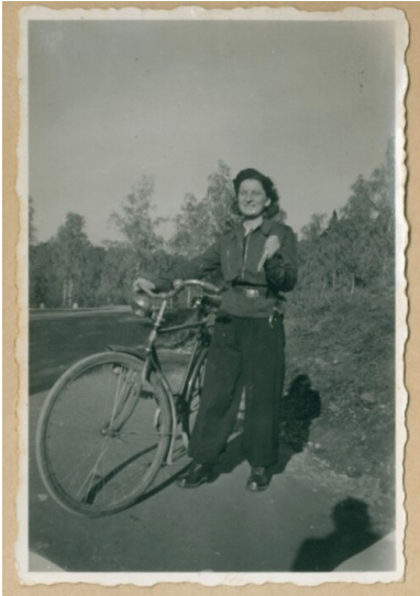
Karta z kroniki „Wędrownych Ptaków”, Fot. Chorągiew Łódzka ZHP