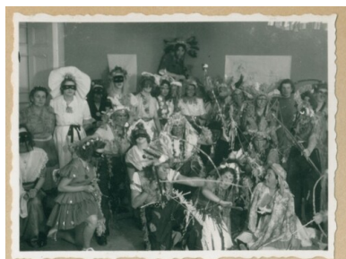
Karta z kroniki „Wędrownych Ptaków”

Liczyła cztery zastępy: „Bociany”, „Jaskółki”, „Pisklaki” oraz „Dzikie gęsi”. Na terenie obozu w Doverstorp, położonego w lesie, drużyna znalazła uroczysko, w którym niemal codziennie odbywały się zbiórki. Dziewczęta nosiły mundurki przygotowane z niebieskich roboczych fartuchów, które ozdabiały białymi kołnierzykami, paskami i sznurami, uplecionymi z białej bibuły. W drużynie pracowano w oparciu o stopnie i sprawności harcerskie, a w ramach ich zdobywania urządzano różne imprezy dla harcerek i wszystkich Polek z obozu.