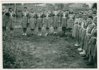
Karta z kroniki „Wędrownych Ptaków”