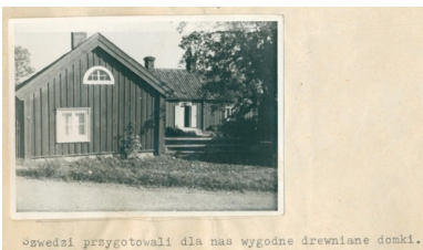
„Szwedzi przygotowali dla nas wygodne drewniane domki.