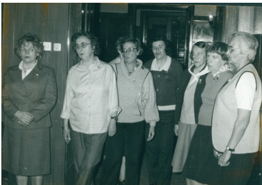
Zlot członkiń „Wędrownych