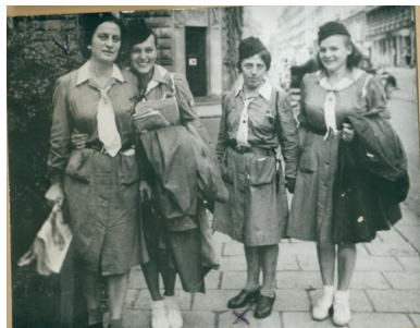
Karta z kroniki „Wędrownych Ptaków”, Fot. Chorągiew Łódzka ZHP