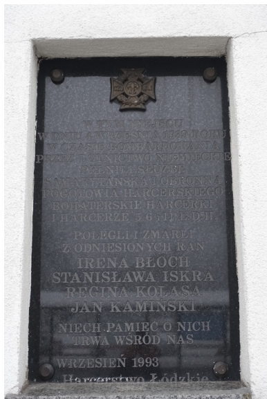
Tablica upamiętniająca poległych harcerzy i harcerki na dworcu Łódź-Widzew.