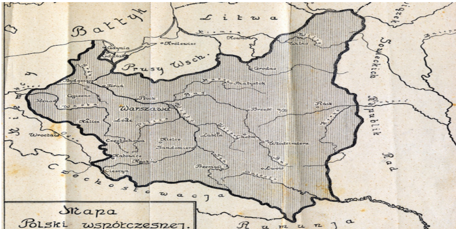
Granice II Rzeczypospolitej

https://przystanekhistoria.pl/pa2/tematy/gruzja/105471,Polityka-wschodnia-Jozefa-Pilsudskiego-w-latach-1918-1920.html