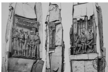
Fragment pomnika Poległych Stoczniowców 1970 przy Stoczni Gdańskiej im. Lenina. Rzeźby prezentujące scenki z życia stoczniowców. Gdańsk, 16 XII 1980 r.

Od strony stoczni znajduje się mur z około 40 tablicami. Zawierają one m.in: 21 postulatów strajkowych, tekst Psalmu 29, wers 11 (wg przekładu Czesława Miłosza) i nazwiska poległych w 1970 roku.