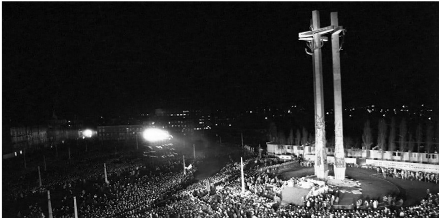
Uroczystość odsłonięcia pomnika Poległych Stoczniovców 1970. Autor: nieznan. Gdańsk, 16 grudnia 1980 r. (fot. domena publiczna)

https://przystanekhistoria.pl/pa2/tematy/grudzien-1970/97341,Na-znak-przestrogi-Gdanski-Pomnik-Poleglych-Stoczniovcow-1970.html