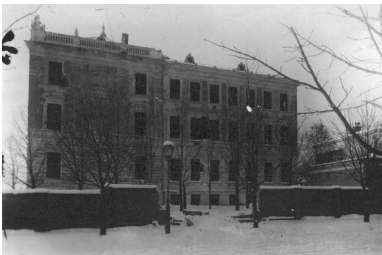
Budynek szkoły im. Sienkiewicza we Lwowie, 1918.