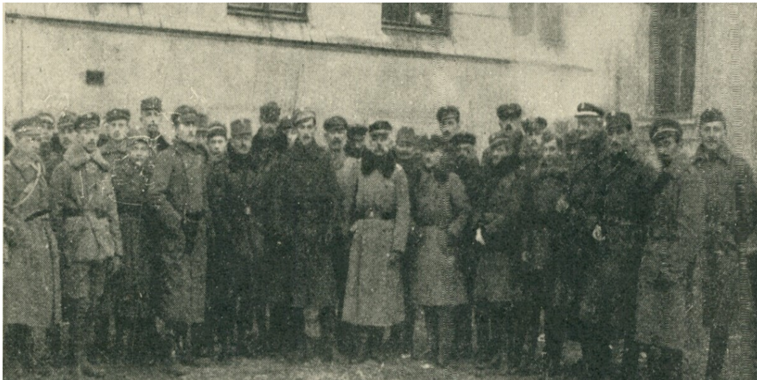
Grupa oficerów załogi szkoły Sienkiewicza.

https://przystanekhistoria.pl/pa2/tematy/granice/88765,Plutonowy-Roman-Feldstein-jeden-z-obroncow-Lwowa.html