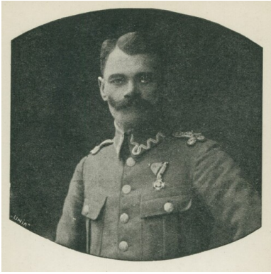
Major Zdzisław Tatar-Trzeźniewski, podczas obrony Lwowa przed Ukraińcami jesienią 1918 r. dowodzący batalionem reduty polskiej w budynku szkoły im. Sienkiewicza przy ul. Polnej.