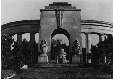
Polska, Lwów. Cmentarz Obrońców Lwowa; widoczny Pomnik Chwały. Zdjęcie z okresu Drugiej Rzeczypospolitej.