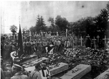
Pogrzeb polskich obrońców Lwowa poległych w obronie tego miasta przed Ukraińcami, listopad 1918 r.