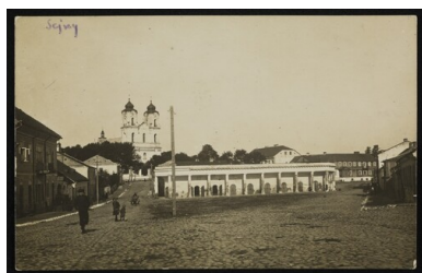
Polska, Sejny, 1918. Pocztaówka ze zbiorów BN - polona.pl

Było to jednak szczególnie trudne w regionach, gdzie Polacy nie stanowili przytłaczającej większości, a zamieszkane przez nich tereny znalazły się w obszarze zainteresowania sąsiednich państw. Taka sytuacja miała miejsce na Suwalszczyźnie, zamieszkałej na początku XX w. głównie przez Polaków i Litwinów.