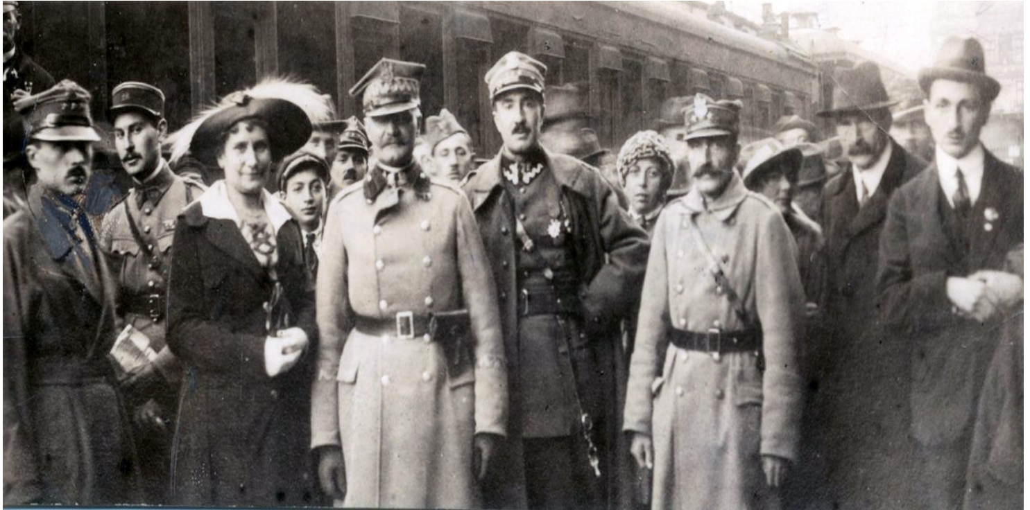
Delegacja polska na rokowania ryskie, w środku gen. Mieczysław Kuliński

https://przystanekhistoria.pl/pa2/tematy/granice/76151,Traktat-ktory-nie-zadowalal-zadnej-ze-stron.html