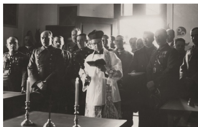
Otwarcie placu sportowego i strzelnicy przy świetlicy KOP w Warszawie.