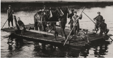
Przeprawa patrolu KOP przez Niemen w powiecie stołpeckim, 1929 r.

Z inicjatywy oddziałów KOP powstawały spółdzielnie spożywców. Początkowo były one tworzone w celu zaspokojenia potrzeb materialnych członków Korpusu, ale w krótkim czasie zaczęły służyć także mieszkańcom Kresów. W ramach działalności spółdzielczej tworzone były wytwórnie, świetlice, kinematografy, jadłodajnie czy herbaciarnie, a sklepy prowadzone przez spółdzielnie KOP miały opinię najlepiej zaopatrzonej i najczystszych w miasteczkach. Spółdzielnie działały przy wszystkich batalionach, a nawet powstawały ich filie przy oddziałach Korpusu. Działalność ta była także formą popularyzowania spółdzielczości. W ruchu spółdzielczym widziano bowiem remedium na biedę ludności wiejskiej Kresów, a propagatorami i jednocześnie twórcami spółdzielni mieli być żołnierze Korpusu, wracający do swoich domów i wsi po odbyciu służby. I tak KOP stał się częścią kresowej społeczności.