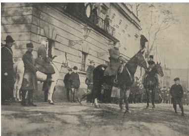
Jerzy Szczurek (w centrum, na koniu) w czasie przysięgi Milicji Polskiej Śląska Cieszyńskiego w Cieszynie.