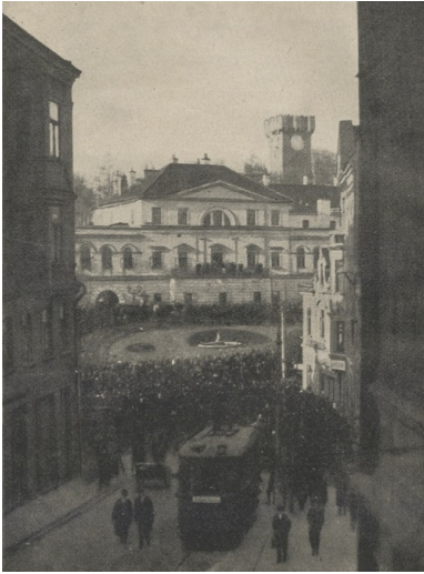
Hołd Milicji Polskiej Śląska Cieszyńskiego w Cieszynie 1918 r.