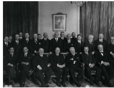
Roman Dmowski (stoi piąty od lewej) na konferencji wersalskiej, 1919 r.

W początkach XX stulecia dawna Rzeczpospolita była tylko wspomnieniem. Na jej wschodnich terenach Polacy stanowili mniejszość, niepewną swojej przyszłości w coraz bardziej wrogim otoczeniu. Ich przeciwnikiem nie były jedynie władze carskie, lecz i lokalne ruchy narodowe, litewski oraz ukraiński, budujące swą siłę raczej na walce z polskością niż na przeciwstawianiu się Rosjanom. Na zachodzie, w zaborze pruskim, polskość cofała się w obliczu skutecznej akcji germanizacyjnej. Pogłębiały się różnice nawet między Polakami zamieszkującymi odrębne zabory.