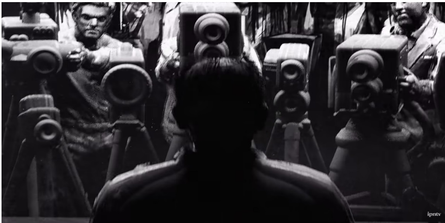
Kadr z animacji IPN "Światło wolności"

https://przystanekhistoria.pl/pa2/tematy/gospodarka/104685,Rozklad.html