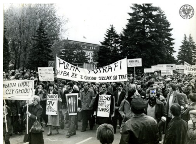
Demonstranci na ulicach Grudziądza. Na niesionych przez protestujących transparentach widoczne hasła, w tym m.in. „WŁADZA LUDU, CZY GŁODU!”. Grudziądz, październik 1981 r.

Optymizmem nie napawał również i stan społeczeństwa. Na stosunki międzyludzkie rzutowało, w niespotykanym dotąd stopniu, czysto psychiczne zmęczenie przedłużającą się sytuacją, której dominującym składnikiem stawało się poczucie beznadziejności i braku realnej perspektywy poprawy. Coraz groźniejsze rozmiary przybierała znieczulica na los bliźniego, mnożyły się przejawy irracjonalnej agresji, normą stawało się zwyczajne chamstwo. Towarzyszyły temu coraz groźniejsze patologie społeczne – od tradycyjnego już alkoholizmu, poprzez wzrost przestępczości, po zataczającą coraz szersze kręgi narkomanię.