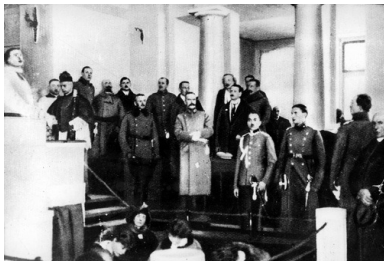
Otwarcie Sejmu Ustawodawczego w Warszawie. Widoczny m.in. naczelnik państwa Józef Piłsudski, 10 lutego 1919 r.

Z dysproporcjami tymi zmagał się już sejm ustawodawczy. Swemu następcy, Sejmowi I kadencji, pomimo wysiłków pozostawił w spadku większość tych problemów. Jednakże to właśnie w okresie jego istnienia rozpoczął się, początkowo trudny do zauważenia, proces integracji całego obszaru państwowego. Proces ten, podskórnie i z oporami, toczył się nadal. Toczył się on w cieniu ekscytujących opinii publiczną coraz to nowych sporów politycznych.