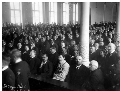
Widok na salę obrad podczas otwarcia sesji sejmowej, 28 listopada 1922 r.

najpoważniejszą rolę odgrywało PSL-„Piast”, padło 24% głosów. Na partie lewicy, przede wszystkim PPS i PSL-„Wyzwolenie”, oddało głosy 25% wyborców. W wyborach tych pojawił się jednak nowy, istotny czynnik. Był nim Blok Mniejszości Narodowych, na którego kandydatów głosowało aż 22% wyborców. Obecność znacznie większej grupy posłów reprezentujących mniejszości narodowe w ważny, a zarazem dramatyczny sposób wpłynęła na przebieg pierwszych wyborów prezydenckich. Dzięki ich głosom pierwszym prezydentem II Rzeczypospolitej został zgłoszony przez PSL-„Wyzwolenie” Gabriel Narutowicz, wybitny uczyony, który po wojnie powrócił ze Szwajcarii, by swój wielki talent oddać w służbę odradzającej się ojczyźnie.