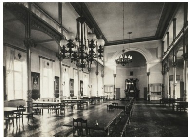
Na fotografii z 1902 r. wnętrze budynku Instytutu Aleksandryjsko-Maryjskiego, który był pierwszą siedzibą parlamentu w II RP.

Odpowiedzią na tę propozycję stał się wybuch, w nocy z 2 na 3 maja 1921 r., kolejnego, trzeciego już powstania. Zryw był najpotężniejszy z dotychczasowych – powstańcy szybko osiągnęli linię Odry. Polityczny błąd Korfanteo, który uznał, że powstanie osiągnęło swój cel i można wrócić do domów, sprawił, że o ziemię śląską trzeba było, w znacznie już trudniejszych warunkach militarnych, nadal krwawo się zмагаć. Powstańcy niejednokrotnie dawali przykłady odwagi, zaciętości i determinacji, wspomnieć należy choćby bitwę pod Górą św. Anny. Ostatecznie Rada Ligi Narodów, w kilka miesięcy po przerwaniu walk, podjęła kompromisową decyzję, na mocy której Polska otrzymała zaledwie 29% terytorium plebiscytowego z około 46% ludności, ale za to z bardzo cennymi z gospodarczego punktu widzenia obiektami przemysłowymi.