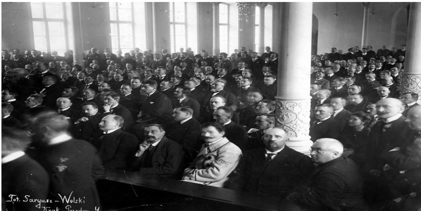
Widok na salę obrad podczas otwarcia sesji sejmowej, 28 listopada 1922 r. Fot. ze zbiorów NAC

https://przystanekhistoria.pl/pa2/tematy/gabriel-narutowicz/98308,Czasy-sejmokracji.html