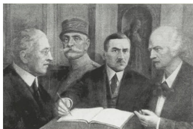
Prezydent Woodrow Wilson, marszałek Ferdinand Foch, Roman Dmowski i Ignacy Paderewski, obraz olejny Kazimierza Szmyta Podpisanie układu wersalskiego , 1923 r.

U progu lata 1918 r. z perspektywy Zachodu problemem takim pozostawały Niemcy – środkowoeuropejskie mocarstwo, wyczerpane wojną, ale dzięki utrzymywaniu panowania nad rozległymi obszarami Europy środkowej oraz wschodniej dysponujące możliwościami szybkiej odbudowy sił. Problemem była także formująca się bolszewicka Rosja. Obawy przed nimi sprawiły, że głos aktywnych na Zachodzie polskich polityków, wskazujących korzyści, jakie z zachodniej perspektywy oznaczać będzie powrót Polski na mapę, został w końcu wysłuchany. W kolejnym miesiącu, po załamaniu się ostatniej z niemieckich ofensyw, alianci uzyskali przewagę, którą utrzymali aż do załamania się niemieckiego oporu 11 listopada. Sprawa polska, pozbawiona szans przez cały wiek XIX, stanęła w obliczu koniunktury, perfekcyjnie wyzyskanej w decydujących miesiącach przełomu 1918 i 1919 roku. Symbolem tych wysiłków stał się 11 listopada 1918 r., oznaczający z polskiej perspektywy upadek ostatniego z zaborców. Ale początkiem drogi, a i zapowiedzią jej kierunku był 3 czerwca 1918 r. - dzień ogłoszenia deklaracji wersalskiej.