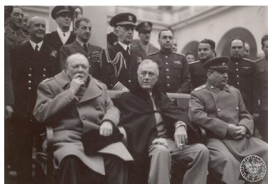
Winston Churchill, Franklin Delano Roosevelt i Józef Stalin podczas obrad konferencji jałtańskiej, luty 1945 r.