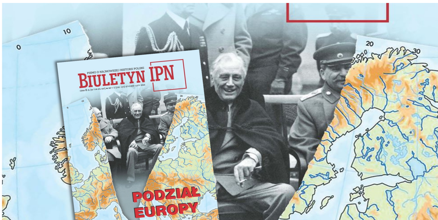
BIULETYN IPN 1-2, 2025

https://przystanekhistoria.pl/pa2/tematy/estonia/125918,Jałta-z-perspektywy-innej-niz-polska.html