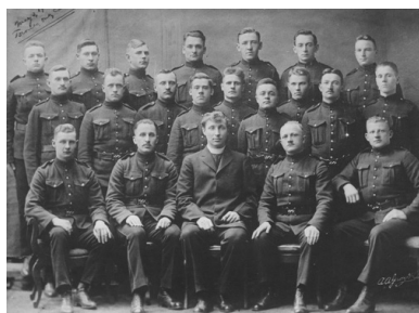
Grupa polskich uczniów i absolwentów szkoły oficerskiej w Toronto. Pierwsi oficerowie polscy z grupy tzw. "Straceńców", 1917 r.

Skonkretyzowanie, i to na szeroką skalę, przygotowań Polonii do czynnego zaangażowania się w wojnę europejską po stronie walczącej z państwami centralnymi następowało w momencie istotnych przemian w polityce Stanów Zjednoczonych.