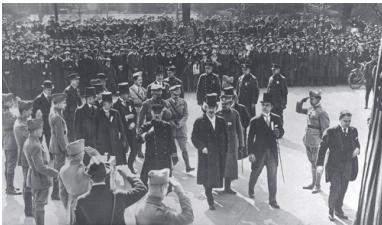
Przedstawiciele polskiej misji wojskowej przed ratuszem w Nowym Jorku. Widoczny m.in. Ignacy Jan Paderewski. Porucznik Józef Sierociński stoi czwarty od lewej, marzec 1918 r.

Nie ukrywał jednak, iż polityczne stanowisko komitetu galicyjskiego, za którym opowiadał się na gruncie amerykańskim KON, ma charakter proniemiecki, więc nie należy go wspierać. W rezultacie osoba Paderewskiego stała się przedmiotem ataków ze strony prasy związanej z KON, co przy znacznej popularności artysty wśród Polonii prowadziło do niezbyt przychylnych reakcji wobec tej organizacji.