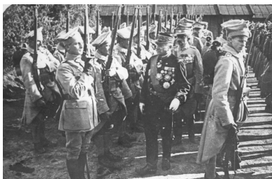
Wizyta szefa francusko-polskiej misji wojskowej generała Louisa Archinarda w ośrodku wyszkolenia Armii Polskiej we Francji w Sille-le Guillaume, 1917 r.

Polityczne zwierzchnictwo nad tą formacją, choć dopiero od 20 marca 1918 r., objął kierowany przez Dmowskiego Komitet Narodowy Polski. Wypełnienie szeregów armii polskiej we Francji nie byłoby możliwe w przypadku automatycznego przeniesienia do niej Polaków służących w armii francuskiej, było ich bowiem zaledwie około 2 tysięcy.