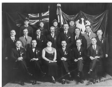
Uroczystość w Toronto z okazji