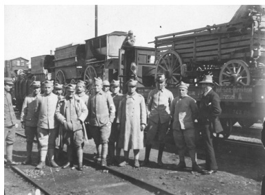
Żołnierze Armii Polskiej we Francji stojący na torowisku przy pociągu z transportem sprzętu wojskowego do Polski, 1919 r.

Warto zdać sobie sprawę, iż na 72 służących w tym pułku oficerów z armii francuskiej wywodziło się 20, z