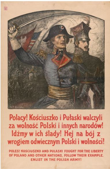
Plakat werbunkowy do Armii Polskiej (autorstwa Władysława Bendy)