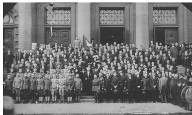
Grupa ochotników z Chicago do Armii Polskiej we Francji, 1917 r.

Próbie doprowadzenia do porozumienia pomiędzy tymi organizacjami podjęli w sierpniu i wrześniu działacze „Sokoła”, ale nie przyniosły one rezultatu. W samym zresztą „Sokole”, traktującym powstały w Galicji Naczelny Komitet Narodowy jako „jawny rząd polski”, nasiliły się objawy zniecierpliwienia, przejawiające się w pomysłach tworzenia złożonej z Polaków siły zbrojnej u boku Francji czy Anglii i to bez uprzedniego uzyskania jakichkolwiek gwarancji politycznych.