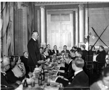
Wizyta marszałka Senatu Władysława Raczkiewicza w Brazylii, 28 czerwca 1933 r.

W tym miejscu nie sposób nie wspomnieć, iż dodatkowy wpływ na wychowanie polskiej młodzieży miały organizacje sportowe, jak Towarzystwo Gimnastyczne „Sokół” czy Towarzystwo Gimnastyczne „Strzelec”. Głównymi ich celami było rozbudzanie uczuć patriotycznych i propagowanie rozwoju tężyzny fizycznej wśród młodego pokolenia Polaków. Największą tego typu organizacją polonijną było Towarzystwo Wychowania Fizycznego „Junak”, które powstało 6 lutego 1923 r. Honorowym prezesem związku wybrany został Józef Piłsudski. Władze „Junaka”, odpowiedzialne były za wielopłaszczyznowy rozwój członków, organizowały zajęcia sportowe, zajmowały się działaniami o podłożu kulturalno-patriotycznym. Do końca 1932 r., w ramach związku działało 8 okręgów, 47 oddziałów, które skupiały 1800 członków (w tym 1400 czynnych). 15