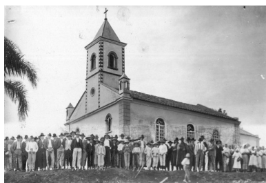
Polski kościół w Grao Para w stanie Santa Catarina, 1929 r.