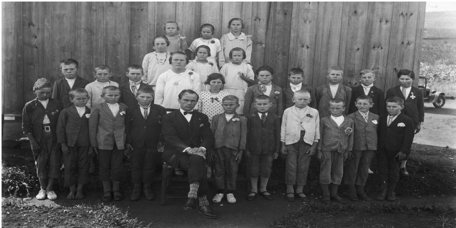
Szkoła polska w Brazylii.

https://przystanekhistoria.pl/pa2/tematy/emigracja/93298,Polacy-spod-znaku-Krzyza-Poludnia-slow-kilka-o-Polonii-w-Brazylia.html