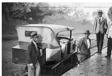
Polscy osadnicy ze stanu Parana w Brazylii, 1934 r.

Przywołany wyżej Polski Komitet Centralny powołany został do życia 16 grudnia 1917 r. w Kurytybie. Był on kontynuatorem działań Komitetu Narodowego Polskiego (statut stowarzyszenia został zatwierdzony 8 lipca 1917 r., w Rio de Janeiro) i oficjalnym przedstawicielstwem paryskiego Komitetu Narodowego Polskiego. 4