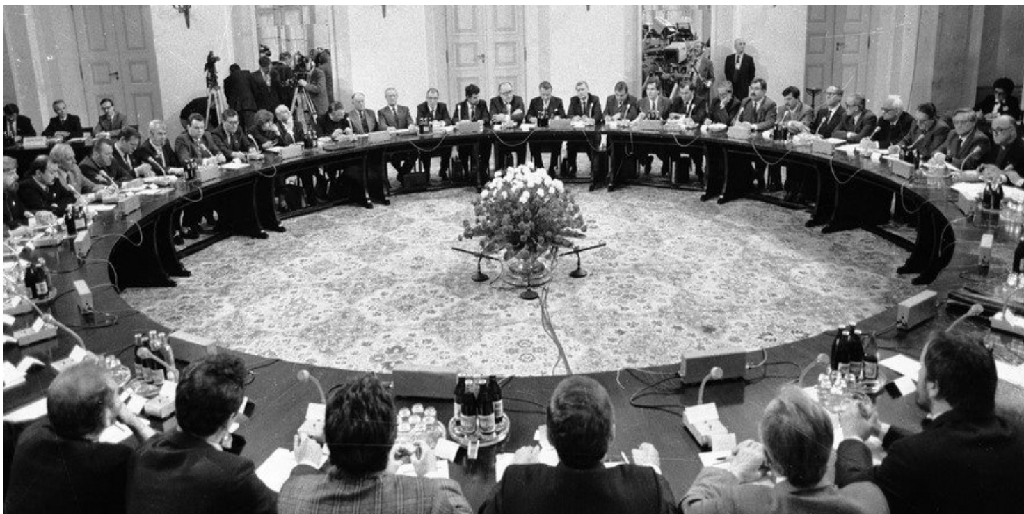
Obrady Okrągłego Stołu

https://przystanekhistoria.pl/pa2/tematy/emigracja/92285,Okragly-Stol-oczami-Czeslaw-Milosza.html