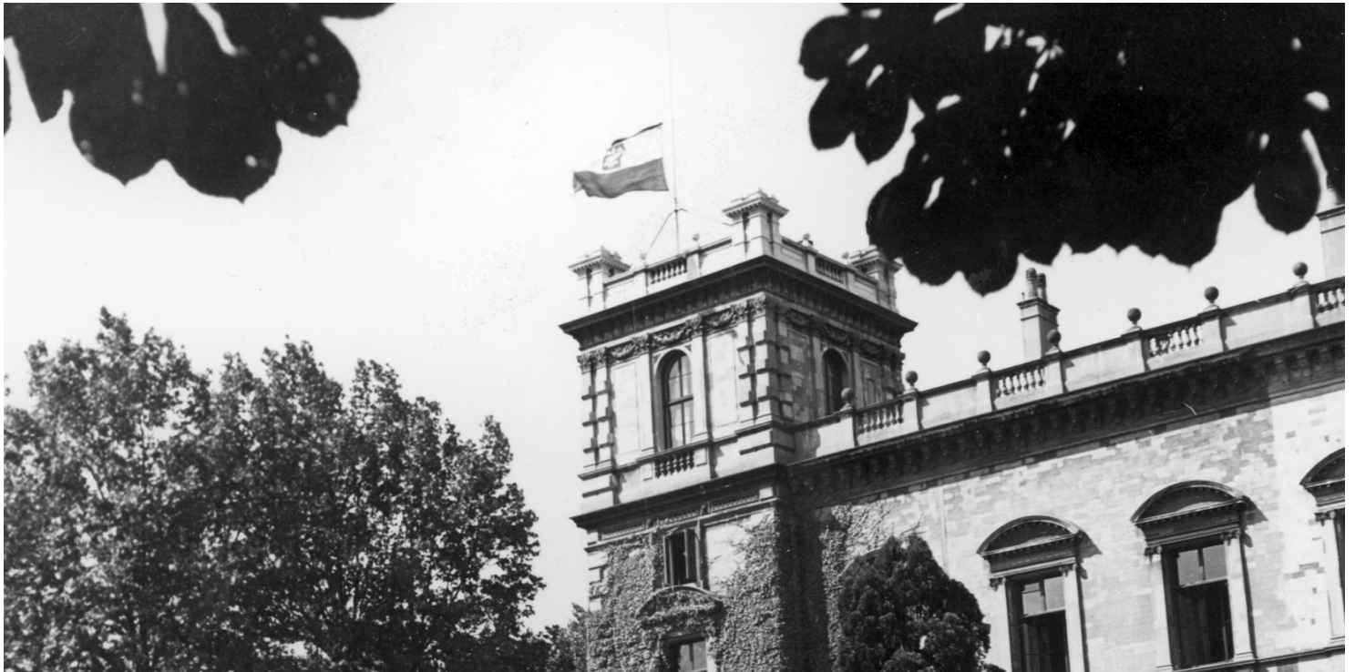
Polska flaga na gmachu siedziby Rządu RP na Uchodźstwie (Pałac Rothschildów), 1943 r.

https://przystanekhistoria.pl/pa2/tematy/emigracja/87769,Autoportret-wychodzcy.html