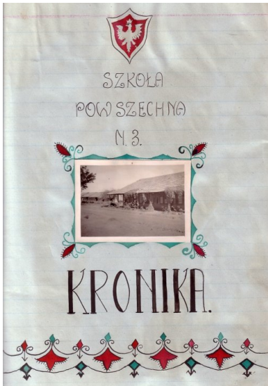
Strona tytułowa kroniki Szkoły Powszechnej nr 3 im. gen. Władysława Sikorskiego w Osiedlu Polskim w Valivade.