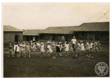
Grupa przedszkolaków z Osiedla Polskiego w Valivade.